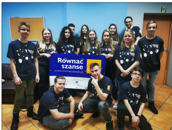
Uczestnicy projektu #JazdaBezTrzymanki

Dzięki projektowi w środowisku lokalnym zmieniło się postrzeżenie młodzieży, gdyż została zauważona jako grupa aktywna, angażująca się w pra- cę. Użytki w Parku za sprawą nowej aranżacji przekształciły się w przestrzeń użytkową, która stała się atrakcją turystyczną dla rodzin. W okresie od jesieni do jesieni dzieci spędzają czas na placu zabaw, a starsze jeżdżą autami na torze. Osoby, które nie posiadają samochodów zdalnie sterowanych, mogą je wypoży- czyć w Gminnej Bibliotece Publicznej w Kęsowie.