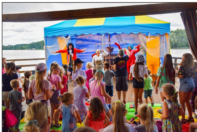
Spektakl Morskie opowieści