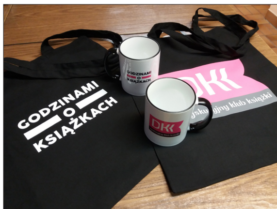
Materiały promocyjne DKK podregionu bydgoskiego

http://biblioteka.bydgoszcz.pl/dzialalnosc-dodatkowa/dkk/informacje-o-projekcie/