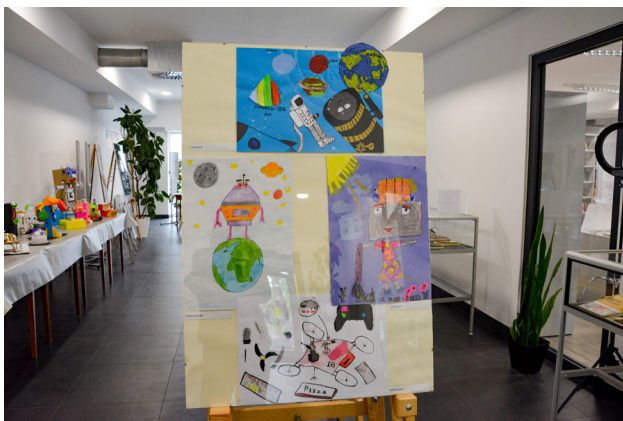
Wystawa prac plastycznych i modelarskich